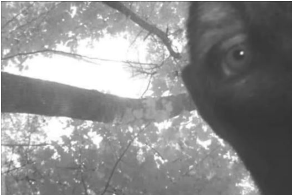
Das angebliche Sasquatch-Foto.

Das Bild ist in Graustufen (sog. Schwarz-Weiß-Foto) und misst in der größten, im Web über eine Suchmaschine findbaren Version 531 x 353 Pixel. Es hat eine Auflösung von 96 ppi und eine Farbtiefe von 24 bit.