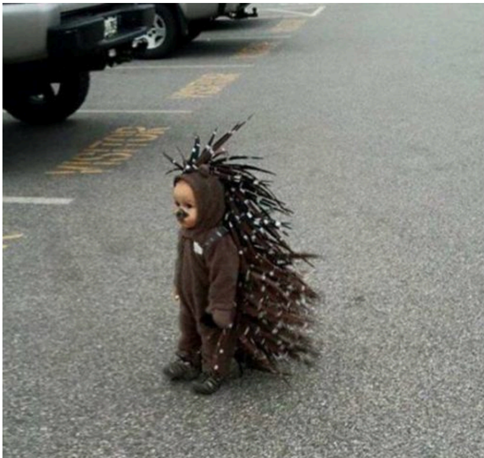
Das Chupacabras-Junge, von einem Supermarkt-Besucher aufgenommen.