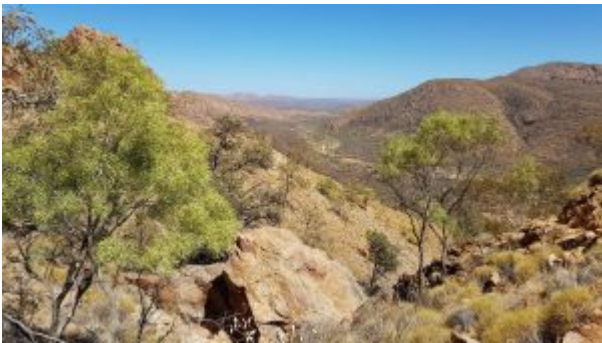
Typische Landschaft im Northern Territory

Im Northern Territory Australiens haben Wildhüter eine Schlange mit drei Augen gefunden. Der etwa 40 cm lange Teppichpython Morelia spilota zeigte ein drittes Auge auf der Stirn, etwa in Kopfmittle.