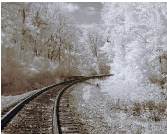
Aufnahme im nahen

Das Maß des im Netz erschienenen Fotos ist ungewöhnlich. 531 x 353 Pixel entspricht keinem gängigen Kamera- oder Vorschaubild-Maß. Das Seitenverhältnis liegt bei etwa 3:2.