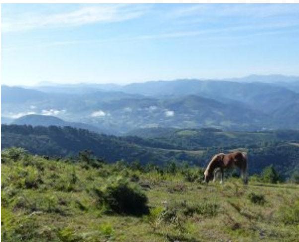
Baskische Landschaft mit Pferd. Ist das das Biotop für einen Affenmenschen?

einer neueren Recherche im Zeitungsarchiv der ABC jedoch nur diesen einen Artikel aus dem Jahre 1979, jedoch nichts für den 8. Mai 1993, weder unter dem Namen des einen Zeugen "Manuel Cazcarra" oder "Peña Montañesa" – nicht einmal, als die Suche für den ganzen Mai 1993 unter den Begriffen „mono“ (Affe), "raro" (komisch), „extraño“ (seltsam) "animal", "Huesca" ausgedehnt wurde. Der Artikel aus dem Jahre 1979 findet sich mit derselben Methode hingegen problemlos ohne großes Suchen – so ist es bei einem anderen Fall eines vermeintlichen Affenmenschen aus dem Jahr 1972 in Alicante.