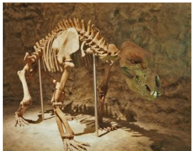
Höhlenbär-Skelett im Naturkundemuseum Braunschweig