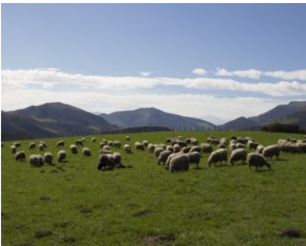
Der Basajaun ist auch der traditionelle Beschützer der Hirten und Herden

Unweit vom Dorf gibt es eine Höhle mit vielen Funden von Höhlenbären. In der Nähe der Höhle gibt es ein Museum, in dem der Besucher mehr über diese Tiere erfahren kann – und neben diesem Museum ein anderes über den vorzeitlichen Menschen. Daher kommt der in der Gegend geläufige Begriff „hombre oso“ „Bärenmensch“. Interessanterweise verwendet Manuel Cacarro diesen Begriff „hombre oso“ in seinem Interview auch zuerst, als er von seiner Begegnung mit dem „Hombre mono“ („Affenmensch“) berichtet (El Cuarto Milenio 1:35:30 – 1:36:40).