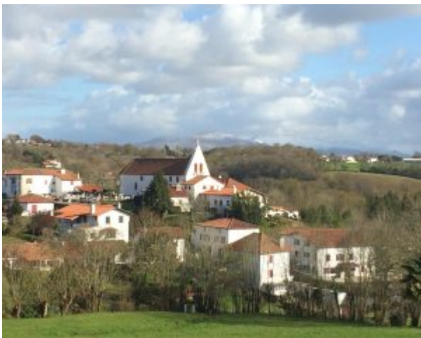
Typisches Dorf im Baskenland

Wie auch seinerzeit das Boulevardblatt El Caso, so ist auch die Mysterysendung El Cuarto Milenio dafür bekannt, dass sie eine Geschichte unnötig aufbläht und die Beiträge mit einer mystischen Aura zu überziehen sucht. Dennoch kommen in dieser Sendung die Zeugen Cazcarra und Belzuz persönlich zu Wort. Cazcarra sagt zum Beispiel ausdrücklich, dass es sich bei dem Wesen um eine Person gehandelt hat. Er habe ganz deutlich die sauberen Arme sehen können (El Cuarto Milenio 1:28:15 – 1:28:22).