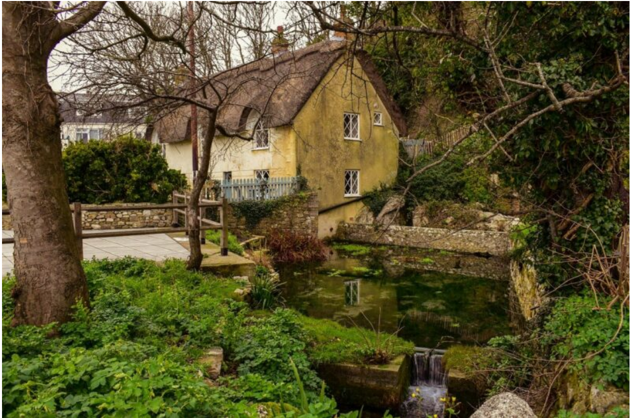
Haus im ländlichen Dorset

Dann stieg ich ab und durchsuchte sacht das lange Gras und die Nesseln der Böschung, von wo es gekommen war. In jedem Büschel saß eine Ratte oder eine Maus. Die Böschung wimmelte nur so von ihnen. Mit einem Stock hätte ich leicht ein Dutzend oder mehr töten können. Sie zogen ganz offenbar als Gruppe, wie sie es bekanntermaßen tun und wie es ihre Kammeraden die Lemminge in großem Maße und unter den geheimnisvollsten Umständen in Norwegen tun, bis sie sich zu Tausenden ins Meer stürzen und so aus eigenem Antriebe das Gleichgewicht in der Natur wiederherstellen.